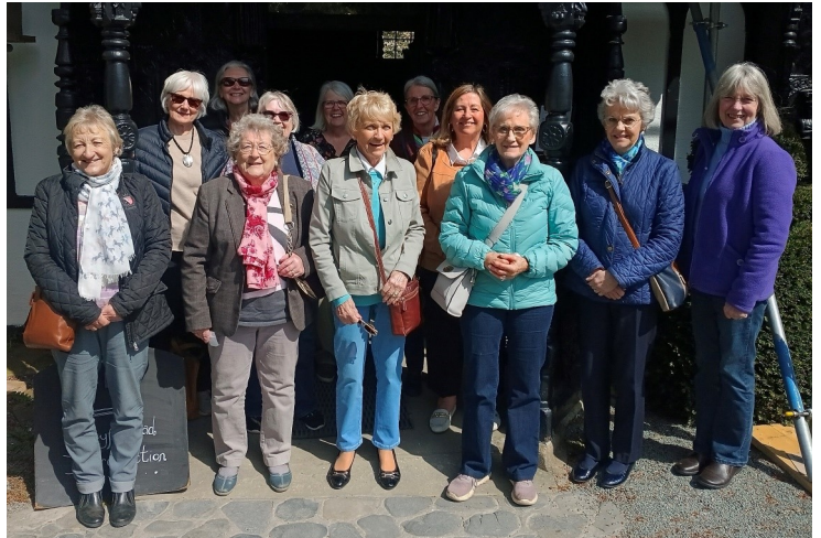
Y merched yn Llangollen