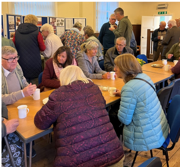
Cymdeithasu ac edrych ar luniau'r arddangosfa ar ôl y sgwrs