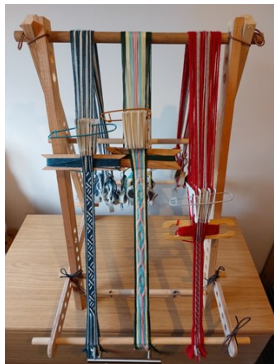
Gwŷdd top-bwrdd wnes i