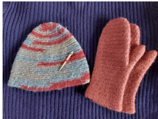
Par o fenig a het wedi'u gwau a thechneg 'nalbinding' â gwllân pur

Diolch yn fawr Tom, a phob hwyl gyda'r dysgu!