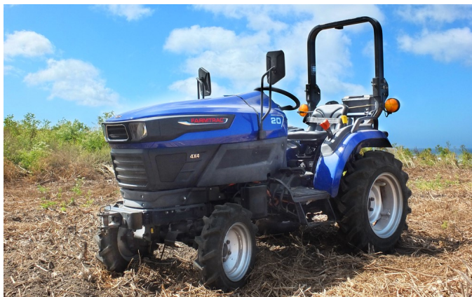
Yn arbennig i Bryn – tractor trydan!