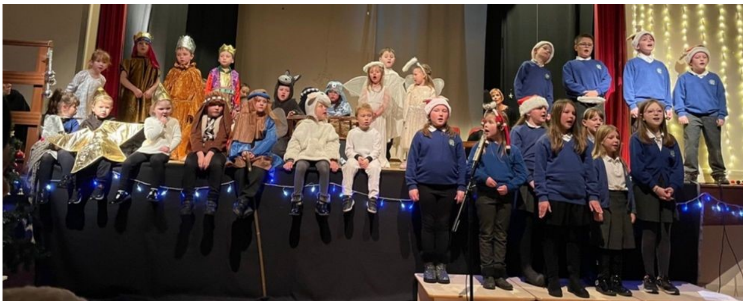
Bu'r plant a'r athrawon yn gweithio'n galed iawn i greu eu sioe Nadolig.