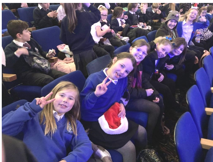
Cafodd pawb hwyl garw yn gwylio'r pantomeim yn y Rhyl!